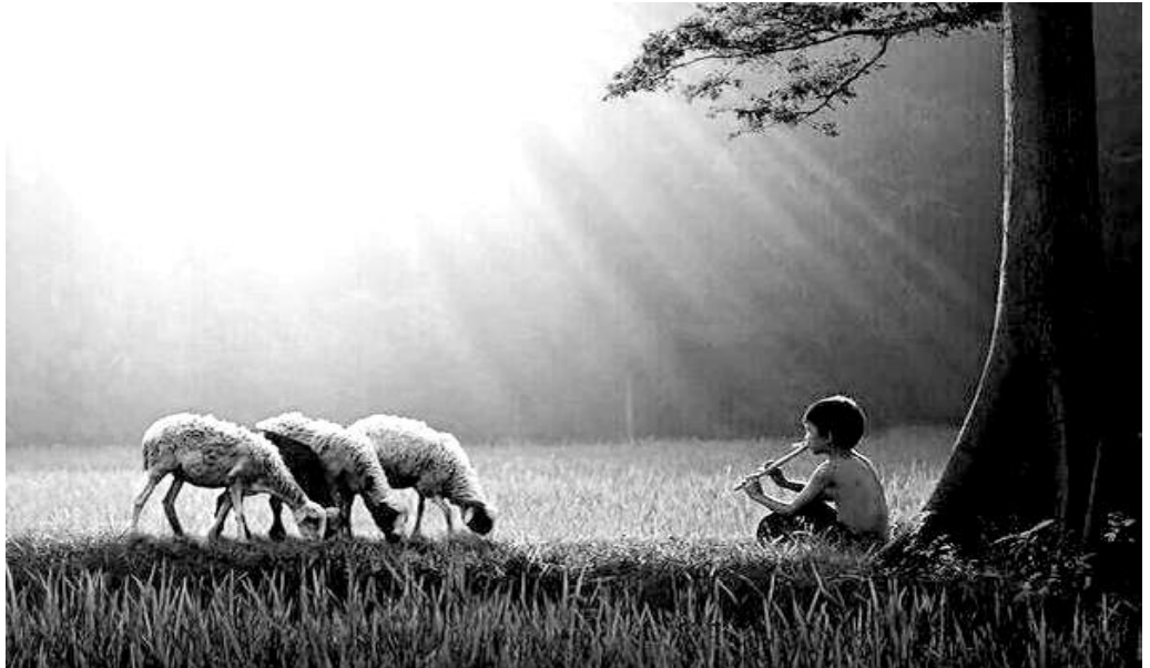
Твір Біяна Расенді. США

пророкували? Хіба не Твоїм ім'ям бісів виганяли? Хіба не Твоїм ім'ям силу чудес творили? І тоді Я їм заявлю: Я вас не знав ніколи! Відійдіть від Мене, ви, що чините беззаконня!»