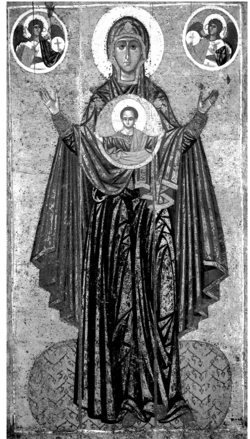
Богородиця Велика Панагія. XII ст.

Земля буде дощенту зруйнована та пограбована вся, бо це слово Господь проказав. Осквернилась земля під своїми мешканцями, бо переступили закони, ...зламали вони заповіта відвічного... Тому землю прокляття поїло, й одержують кару мешканці її... Іс. 24: 3, 5, 6