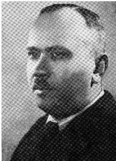
Галичині 1880 — 1930» (1939).