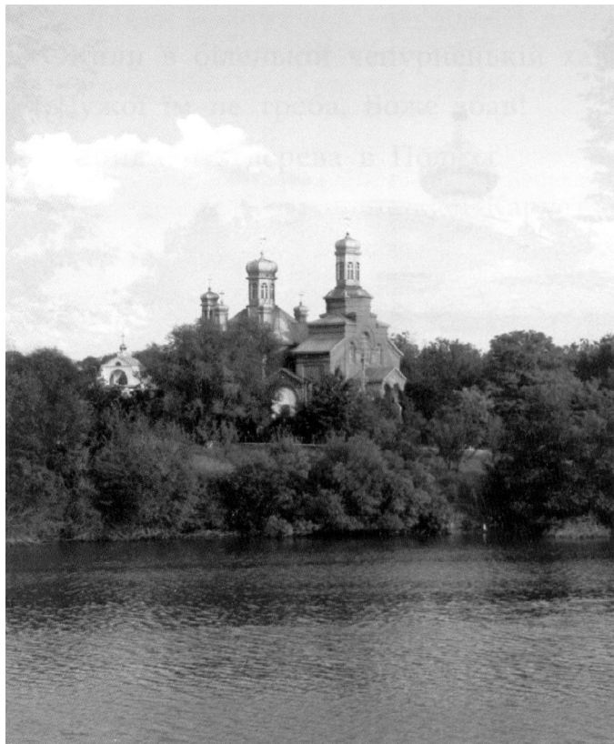
Храм Св. Покрови в с. Рубанівському на Січеславщині. В цьому селі у 1843 р. був гостем Тарас Шевченко.

Дай же, Боже, коли-небудь Хоч на старість стати На тих горах окрадених У маленькій хаті.